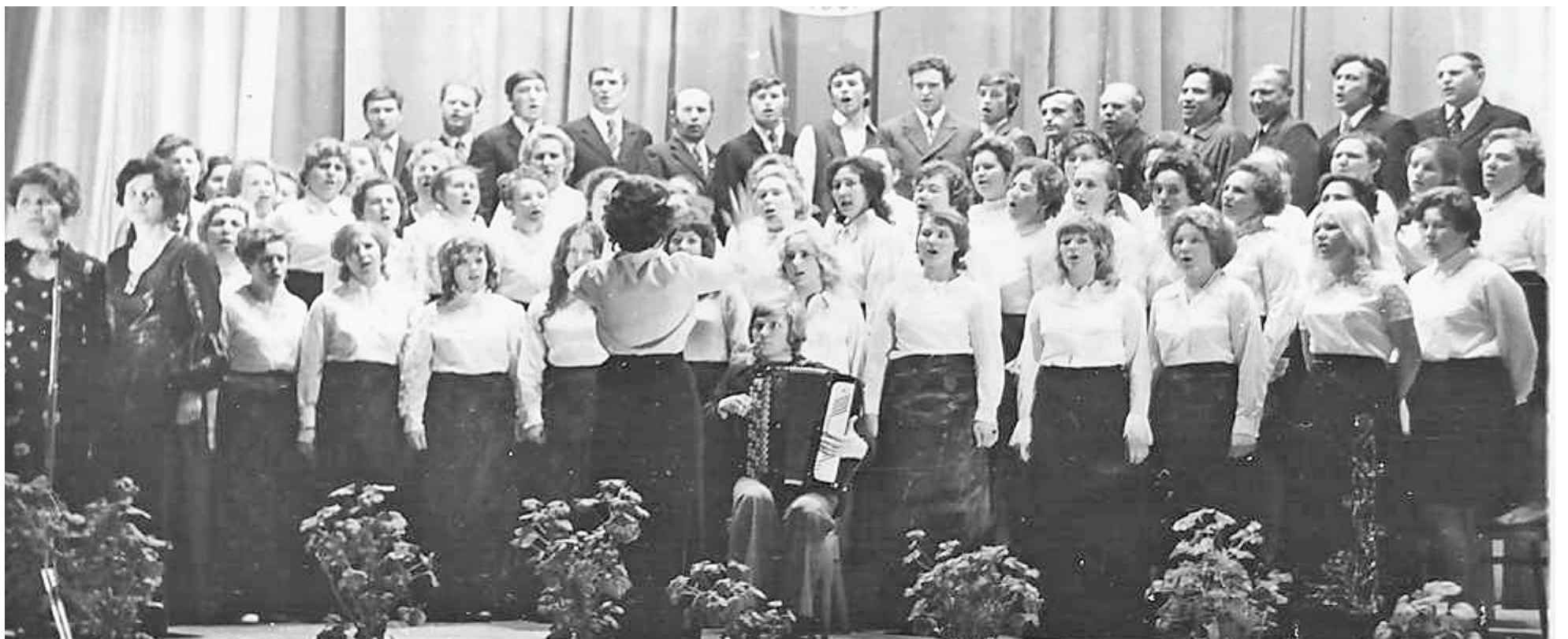
Хор Думиничского ЧЛЗ на фестивале самодеятельного творчества трудящихся.