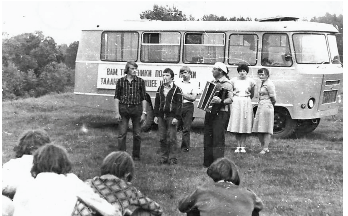
Агитбригада в гостях у тружеников села.

Юбилейные мероприятия, праздники урожая и первого снопа, выступления агитбригад на полях и фермах, чествование победителей соцсоревнования, фестивали и конкурсы разного уровня и разной тематики, торжественные регистрации ново-