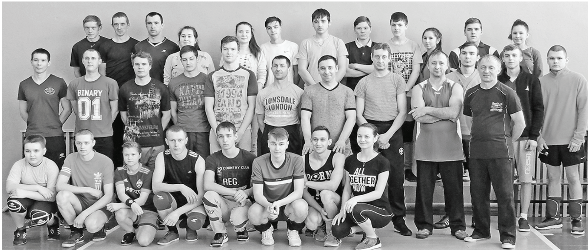
В Вёртнем со спортом дружат и взрослые, и дети.